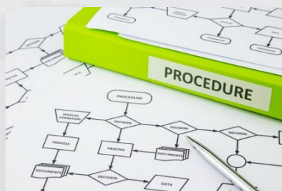
Procédure par finalité

La loi organique de 2004 sur la PDP dénombre les normes à respecter