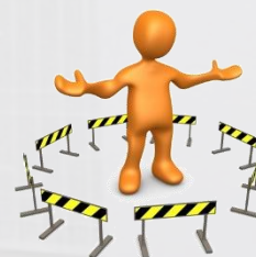
Respect de la finalité