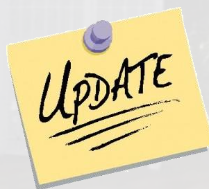
Mise à jour